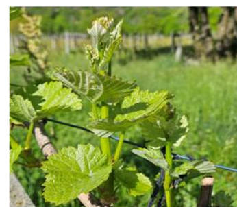
Vite, Chardonnay, Biasca, 28.04 Stadio BBCH 53, grappoli visibili