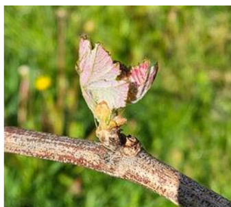
Vite, Merlot, Malvaglia, 28.04 Stadio BBCH 10, emergenza foglie

Lo sviluppo vegetativo della vite è come sempre molto variabile a seconda dell'esposizione, dell'altitudine e ovviamente della varietà. Allo stato attuale, nelle zone e nelle varietà più precoci le piante si trovano nella fase di grappoli visibili (BBCH 53) o bottoni fiorali agglomerati (BBCH 55). Nelle zone più tardive sono presenti parcelle nella fase di emergenza foglie (BBCH 10).